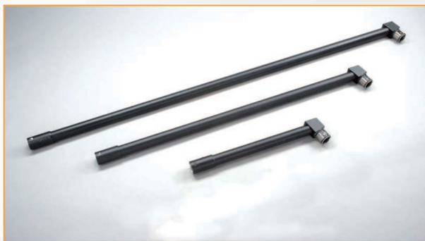
长杆：适用于较高物体热收缩